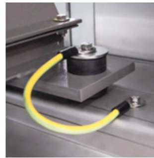
Elastomerdämpfer für hohe Radial- und Axialkräfte