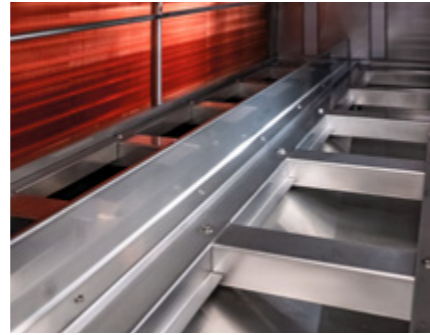
Kupferregister und Wanne mit Wellenbrecher

Die Ventilator-Motoren sind natürlich vibrationsgedämpft. Auf die Bedürfnisse der Bewegungen zur See hat sich WEGER perfekt eingestellt: ob mit „Wellenbrechern“ in Kondensatwannen oder besonderen Kabeln und deren Schutz.