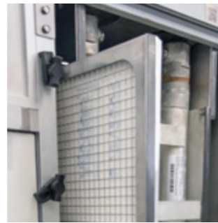
Paneelfilter mit Steck- rahmen zum Wechseln der Filtermatten